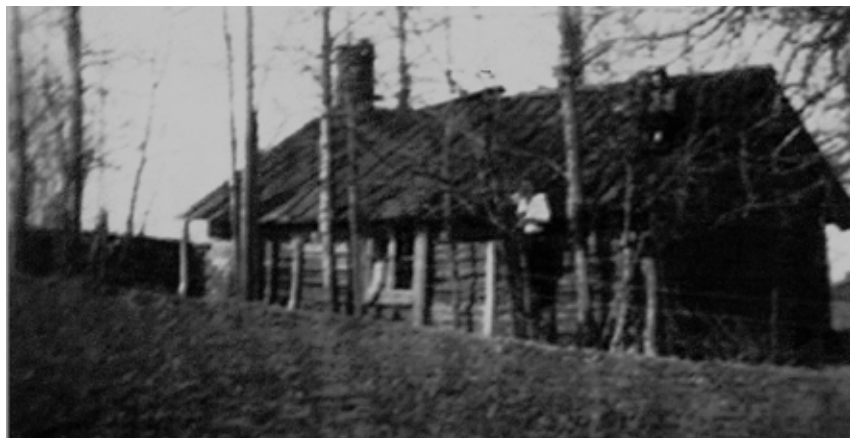
Smedjan i Äspås. Årtal okänt.