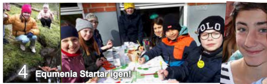
4 Equmenia Startar igen!