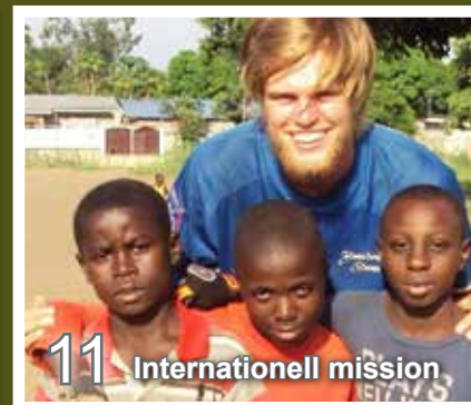
11 Internationell mission