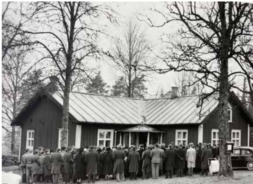
Gamla missionshuset i Stora Hestra som byggdes 1880. Bilden är tagen 1954.