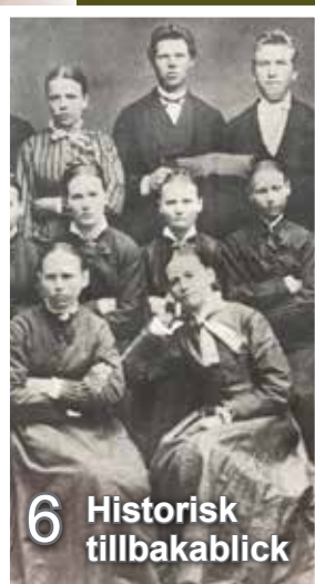
6 Historisk tillbakablick